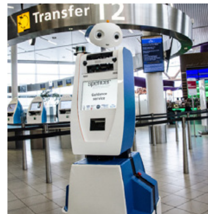
Foto: Der Roboter SPENCER vom Forschungszentrum der Robert Bosch GmbH

Das Fraunhofer-Institut für Produktionstechnik und Automatisierung (IPA) in Stuttgart sowie der Forschungscampus der Robert Bosch GmbH in Renningen waren die Exkursionsziele der Mobilien Robotik.