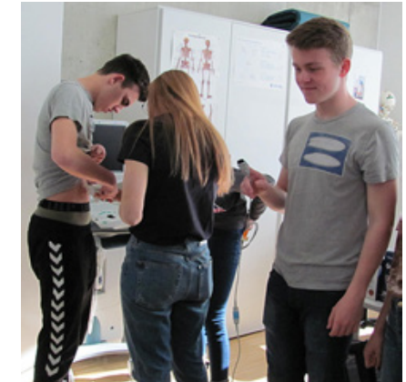
Foto: Die Schüler/innen des Ellenrieder Gymnasiums bestimmen während des Workshops der Gesundheitsinformatik an der HTWG ihre Parameter wie Körperfett (li) und Sauerstoffsättigung im Blut (re).